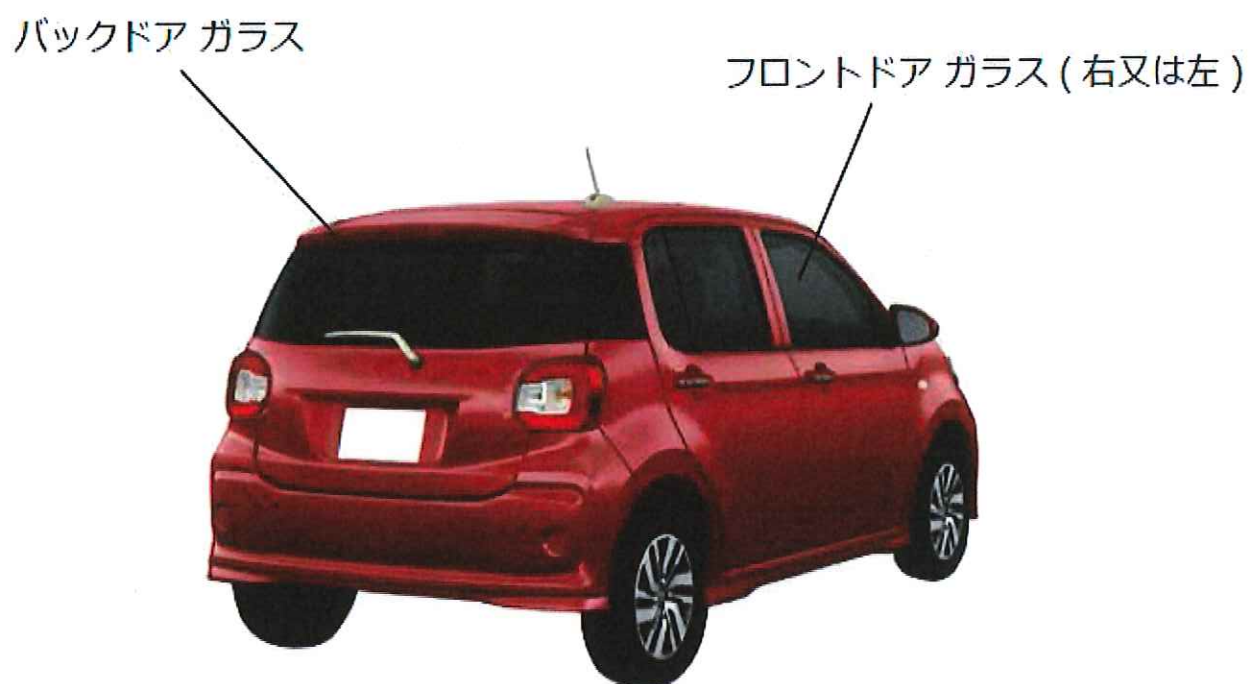
図1 フィルムの施工箇所 【1級】